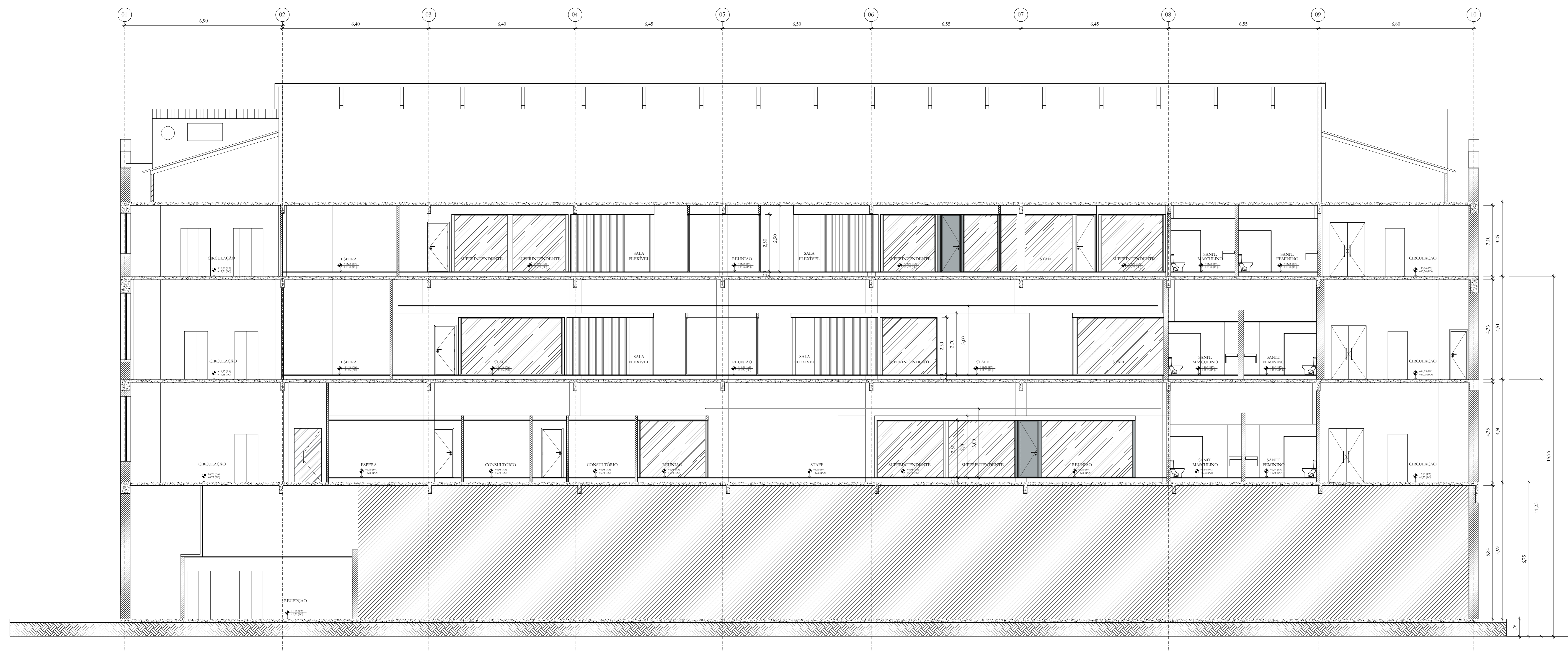
1 CORTE AA